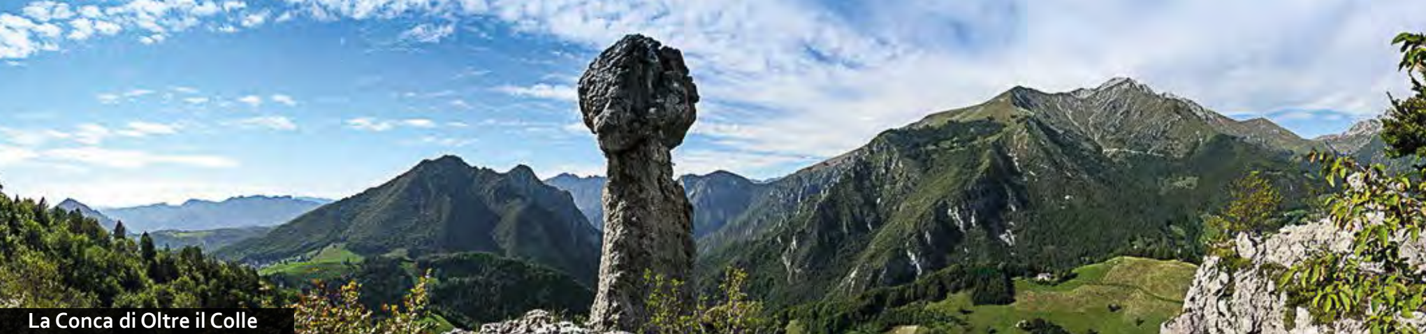
La Conca di Oltre il Colle