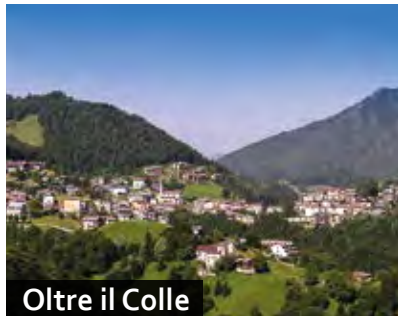
Oltre il Colle